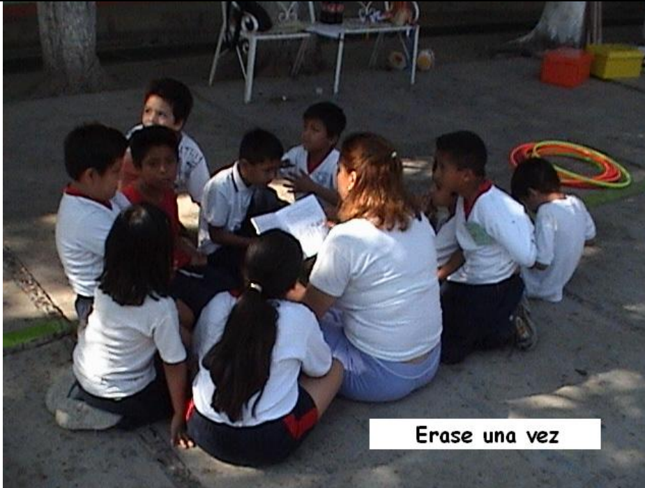
Erase una vez