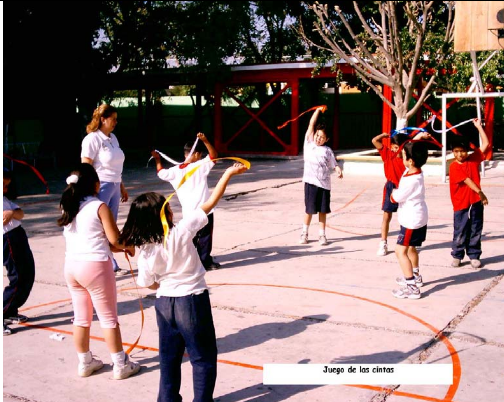
Juego de las cintas