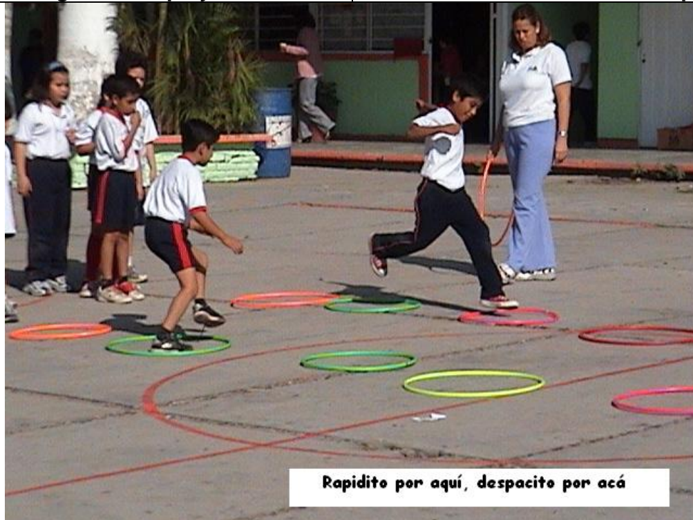
Rapidito por aquí, despacito por acá