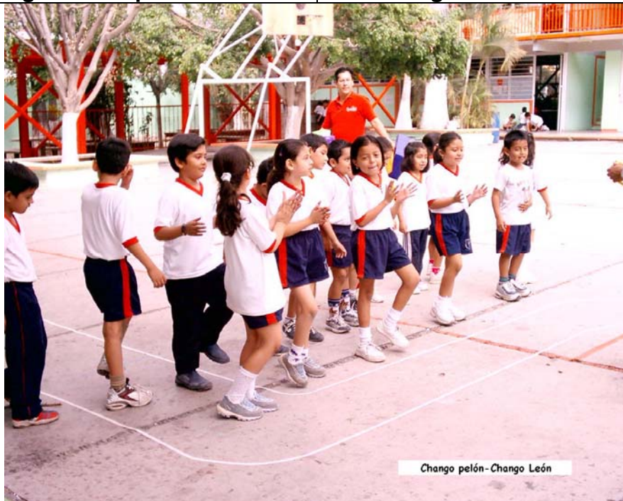
Chango pelón- Chango León