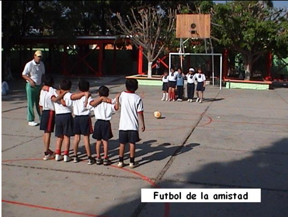
Futbol de la amistad