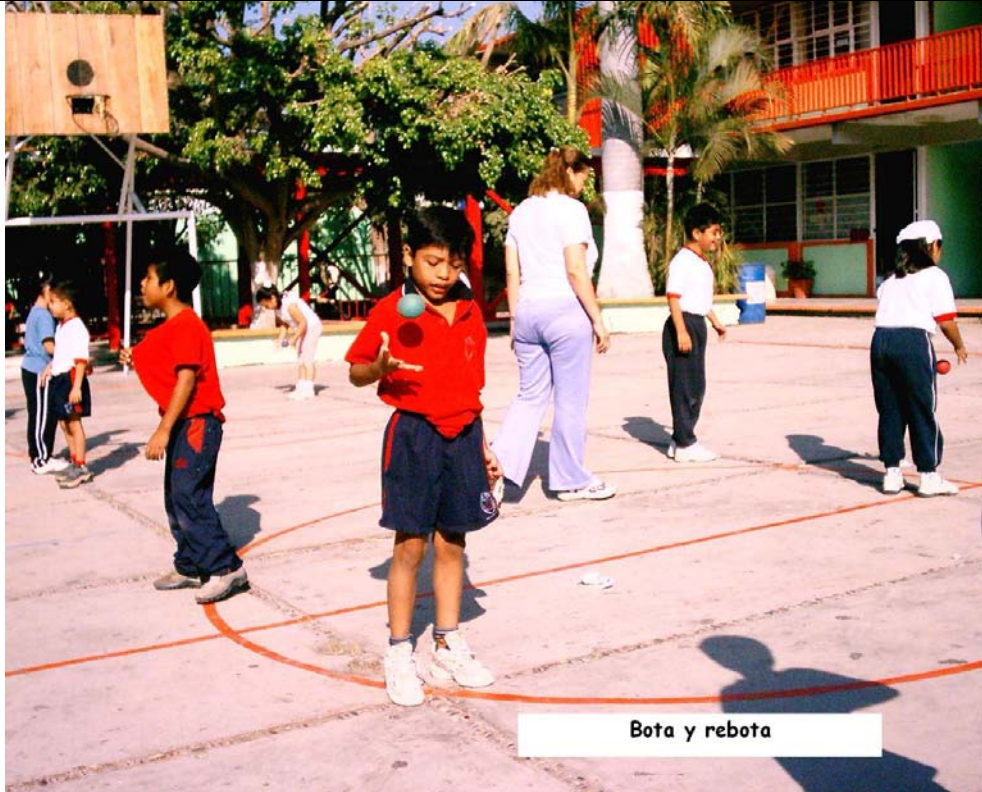
Bota y rebota