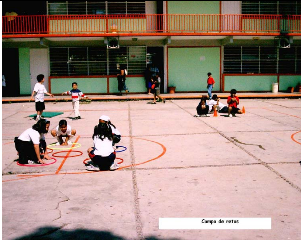
Campo de retos